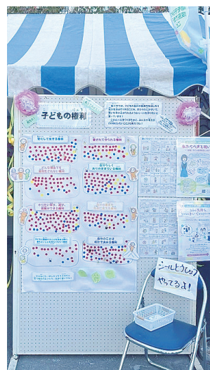
市民まつりで実施した「子ども向けシール投票」