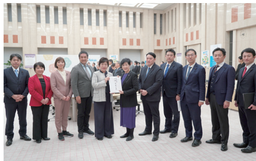
「都議会立憲民主党・ミライ会議・生活者ネットワーク・無所属の会」の会派メンバー

3月11日(水) 18:45～ 東京電力本店前(千代田区内幸町1-1-3/内幸町駅、新橋駅) 呼びかけ:経産省前テントひろば 070-6473-1947/たんぼぼ舎 03-3238-9035