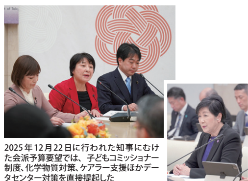
2025年12月22日に行われた知事にむけた会派予算要望では、子どもコミッショナー制度、化学物質対策、ケアラー支援ほかデータセンター対策を直接提起した

化学物質問題は、生活者ネットワークが長年取り組んでいる課題です。PFASについては、血液検査と健康相談の実施を知事に要望しました。